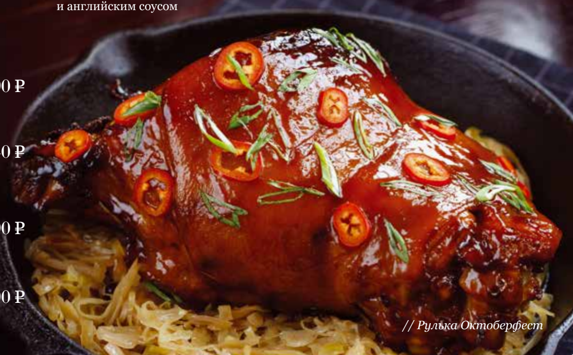
// Рулька Октоберфест

Говядина Веллингтон..... 420 г 990 Р классическое английское блюдо - говяжья вырезка с грибами, подается в слоеном тесте с пюре из топинамбура