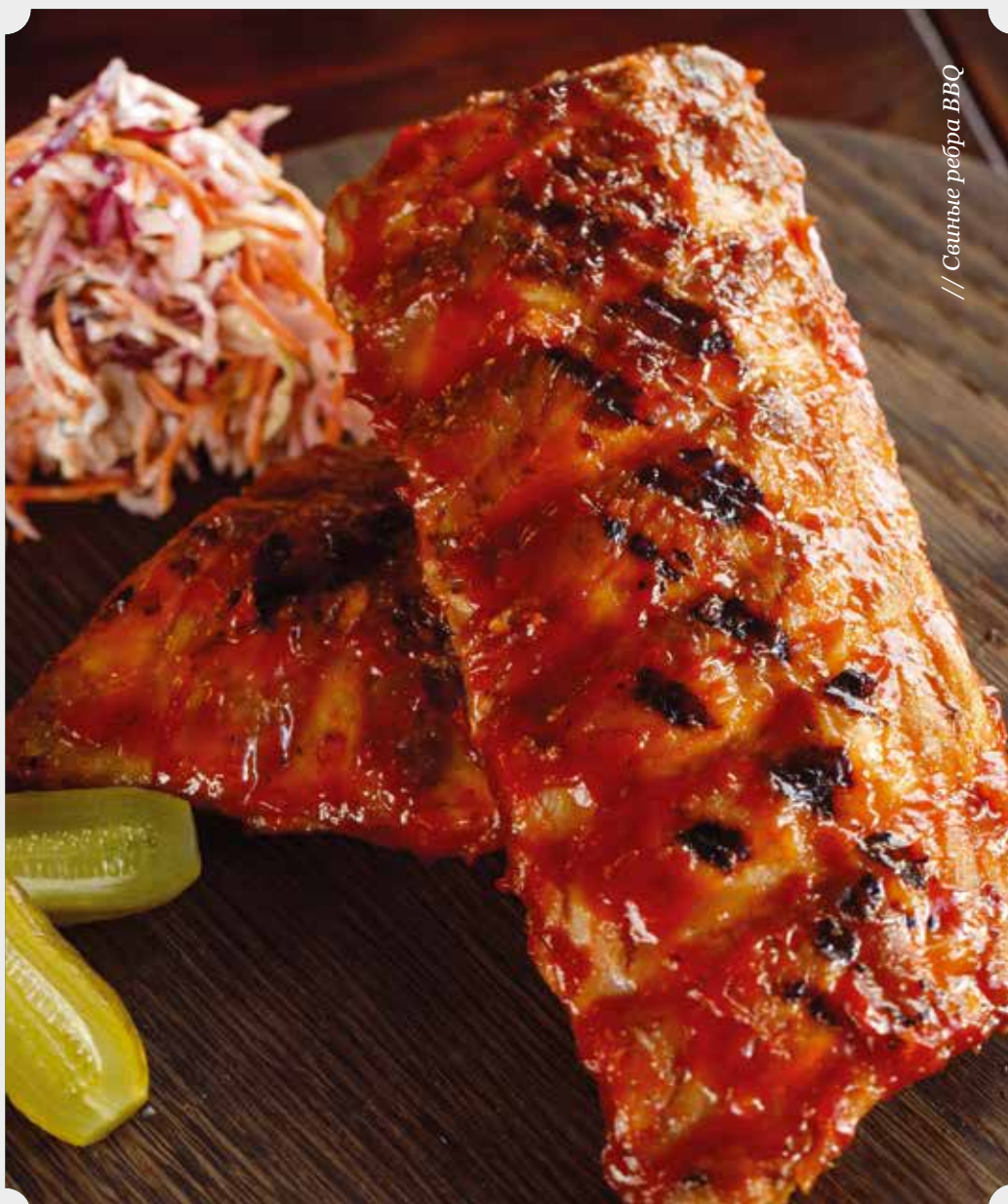
// Свинные рёбра BBQ