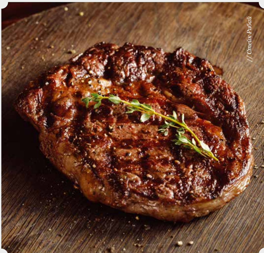
// Стейк Рибай