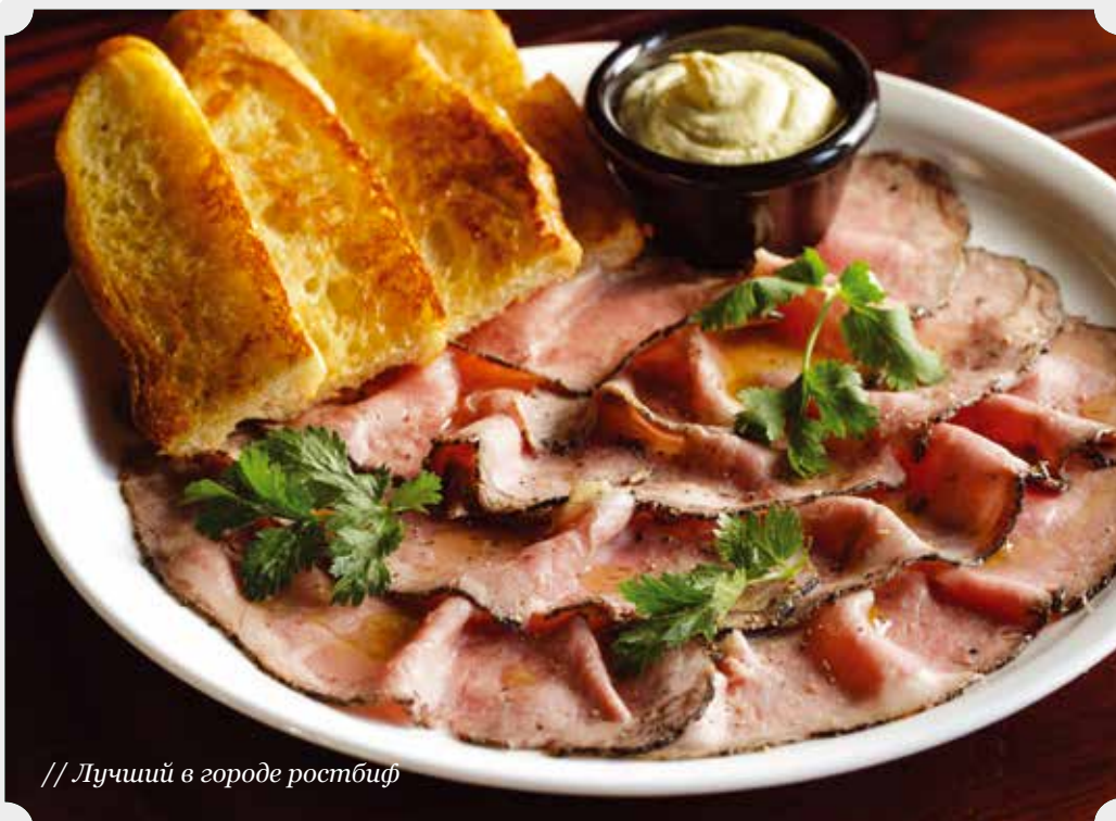
// Лучший в городе ростбиф

Орешки в солёной карамели..... 190 Р арахис, миндаль, кешью, грецкий орех