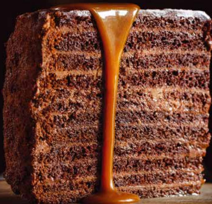
// Шоколадный торт